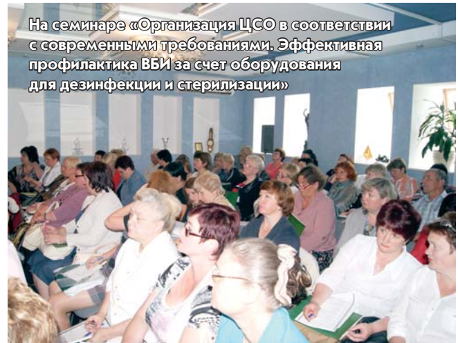
На семинаре «Организация ЦСО в соответствии с современными требованиями. Эффективная профилактика ВБИ за счет оборудования для дезинфекции и стерилизации»

Подготовлено пресс-службой ООО «Фармстандарт-Медтехника»